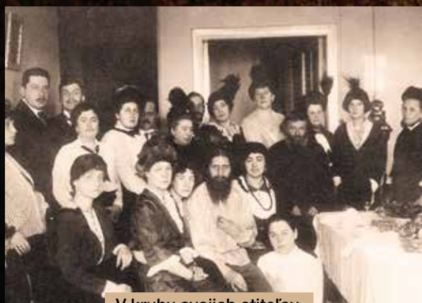
V kruhu svojich ctiteľov.