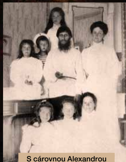
S cárovnou Alexandrou a jej deťmi.

V decembri 1916 vylákal princ Jusupov Rasputina do svojho paláca. Rasputin bol zavedený do pivnice, kde mu ponúkli otrávené koláče a víno. Koláče ho nezabili. Rasputina zastrelili a jeho telo hodili do rieky Nevy. Rasputinova predpoveď sa naplnila.