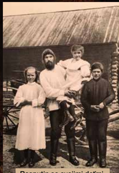
Rasputin so svojimi deťmi.

Mal pravdepodobne nadpriemernú sexuálnu žiadostivosť, a tak už v ranej mladosti mal povest' darebáka, záletníka a opilca. Napriek tomu boli k nemu ľudia zhovievaví. Pitia a voľného sexuálneho života sa nevzdal nikdy, ani po svojom obrátení, keď sa veľa modlil a putoval po sibírskejších kláštoroch. Bol považovaný za liečiteľa, proroka, svätca. Tvrdil, že je nutné hrešiť, aby bolo možné sa kajať.